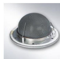
Palnik gazowy MatriX-compact