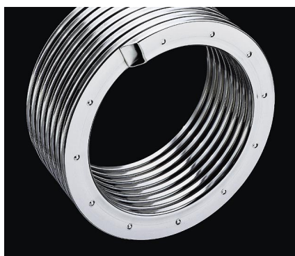
Powierzchnia wymiany ciepła Inox-Radial z nierdzewnej stali szlachetnej