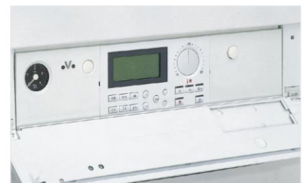
Regulator Vitotronic 200