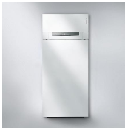
Vitodens 333 ze zintegrowanym ładowanym zasobnikiem ciepłej wody (pojemność 86 litrów)