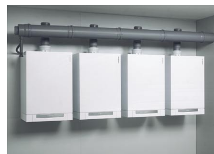
Vitodens 300 o mocy od 12,2 do 66 kW, dla instalacji wielokotłowych do 264 kW