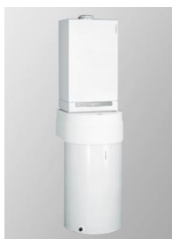
Vitodens 200 i Vitocell-W 100 z obudową