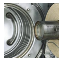
Palnik cylindryczny ze stali nierdzewnej