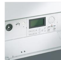
Regulator Vitotronic 200