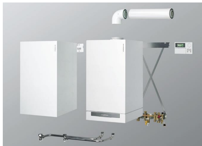
Komponenty systemowe kotłów serii Vitodens